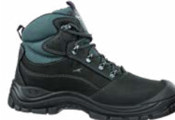
63.170.0 ROCKY MID S3 SRC