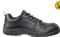
64.610.0 BUSINESS CSL LOW S3 ESD SRC