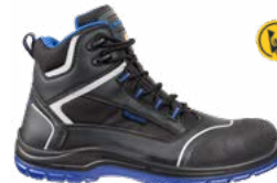
63.115.0 BLUETECH MID S3 ESD SRC