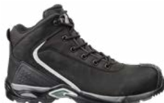
63.169.0 RUNNER XTS MID S3 HRO SRC