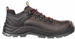
64.135.0 ENDURANCE LOW S3 SRC