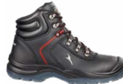
63.108.0 GRAVITATION MID S3 SRC