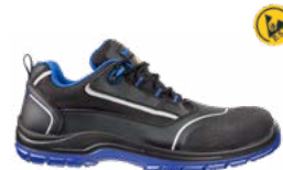
64.110.0 BLUETECH LOW S3 ESD SRC