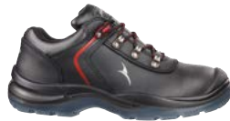
64.108.0 GRAVITATION LOW S3 SRC