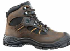
63.134.0 TIMBER MID S3 SRC