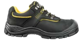
64.134.0 GRAVEL LOW S3 SRC