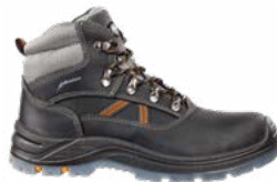
63.165.0 FUNCTION MID S3 SRC