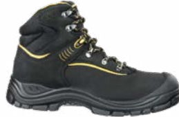
63.133.0 GRAVEL MID S3 SRC