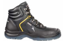
63.112.0 GRAVITY CTX MID S3 WR SRC