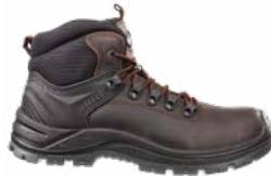
63.132.0 ENDURANCE MID S3 SRC