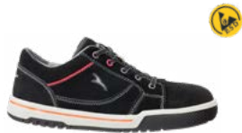
64.196.0 FREESTYLE BLACK LOW S1P ESD SRC