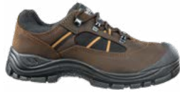
64.133.0 TIMBER LOW S3 SRC