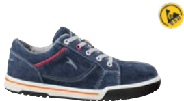
64.195.0 FREESTYLE BLUE LOW S1P ESD SRC