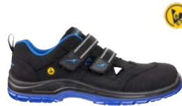
64.111.0 BLUETECH AIR LOW S1P ESD SRC