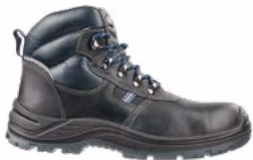
63.186.1 UNIT MID S3 SRC